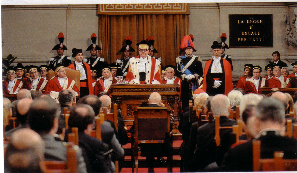
L'APERTURA DELL'ANNO GIUDIZIARIO ALLA CORTE DI CASSAZIONE LO SCORSO GENNAIO